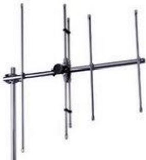
Antenna VHF (K5-K12)